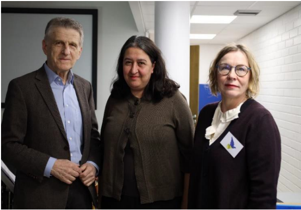
Suomi-Syyria Ystävyyssseuran Rauhan konsertti Ukrainan kansan tueksi 11.3.2022.

Osallistuimme järjestöjen yhteisiin vaikuttamiskampanjoihin, mielenosoituksiin ja tempauksiin (17), joissa nostimme esille maahan muuttaneiden naisten aseman ja tarpeet.