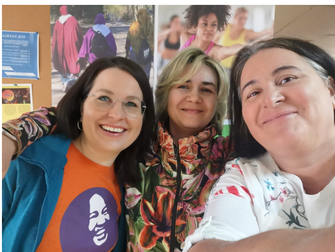
Monaliikun ja SVK:n monikulttuurinen äitienpäivätapahtuma toimintakeskus Graniitissa 7.5.2022.