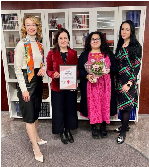
Demarinaiset palkitsivat Monika-Naiset liitolle vuoden tasa-arvotoimijaksi 26.10.2022