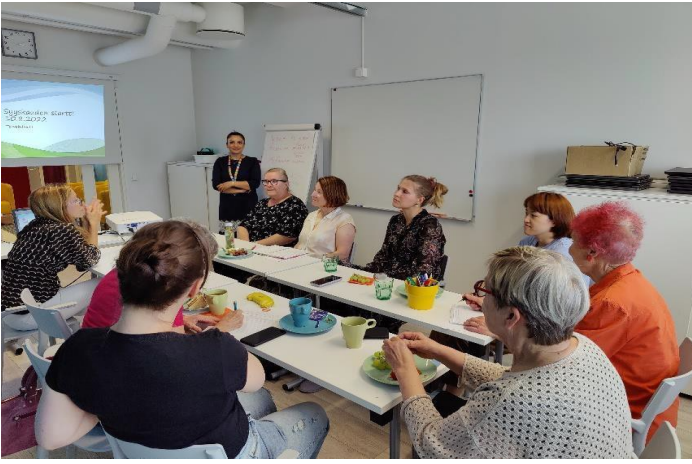
Vapaaehtoistoiminnan syyskauden startti 10.8.2022.

Vapaaehtoistoiminnan rakenteita ja organisointia uudistettiin yhdessä vapaaehtoisten kanssa. Kotoutumiskeskus Monika ja Turvakoti koordinoivat yksiköidensä vapaaehtoistoimintaa. Yksiköt rekrytoivat uusia vapaaehtoisia täsmällisiin tarpeisiin ja perehdyttivät tehtäviin.