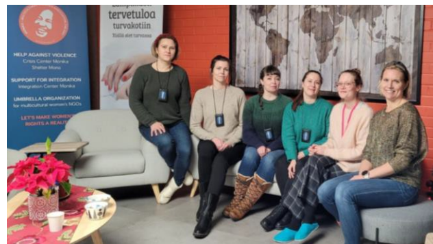
Koulutus Helsingin poliisin ennalta estävän toiminnon Ankkuri- ryhmälle ihmiskaupan teemasta 12.12.2022.

Pitkäaikaisen vaikuttamistyön tavoitteita edistyi. Päättäjät hyödynsivät Kriisikeskuksen asiantuntemusta merkittävässä lakihankkeissa. Laki pakkoavioliittojen kumoamisesta hyväksyttiin eduskunnassa. Päättäjien ja viranomaisten tietämystä onnistuttiin lisäämään tavoitteiden mukaisesti.