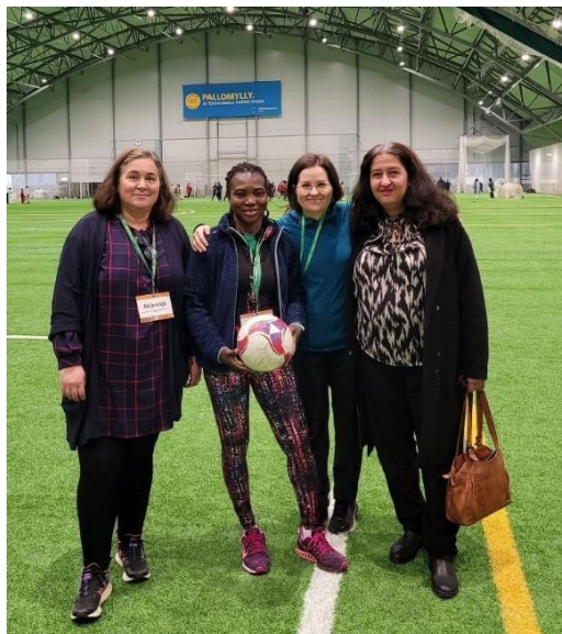
Monaliikun Football4Diversity & Mental Health -tapahtuma 29.10.2022.

Jäsenjärjestöjen osaaminen vahvistui: niiden saamien rahoitusten määrä kasvoi 83 % (v. 2021: 18 %). Järjestöt osasivat hallinnoida paremmin niille myönnettyjä julkisia avustuksia ja toimia vastuullisina työnantajina ja pystyivät paremmin kanavoimaan tukea omalle jäsenistölleen ja kohderyhmät hyötyivät tuesta enemmän. Myös naisjärjestötoiminnan vaikuttavuus ja osallisuus lisääntyivät.