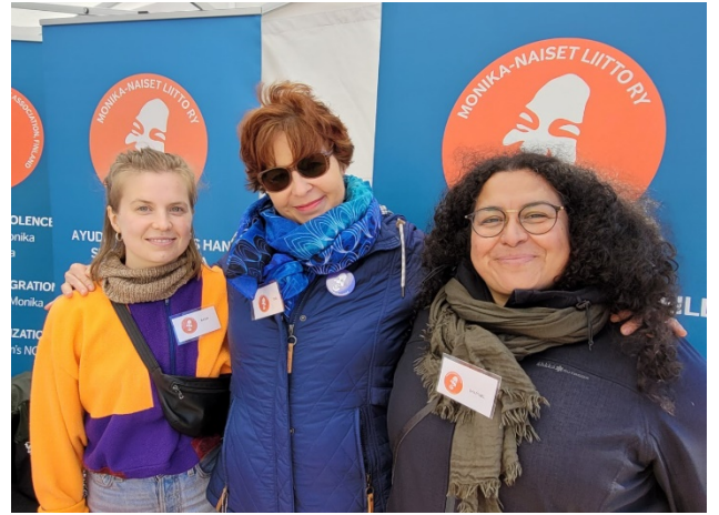
Vapaaehtoiset mukana esittelemässä Monika-Naiset liiton toimintaa Maailma kylässä -festivaalilla 29.5.2022.