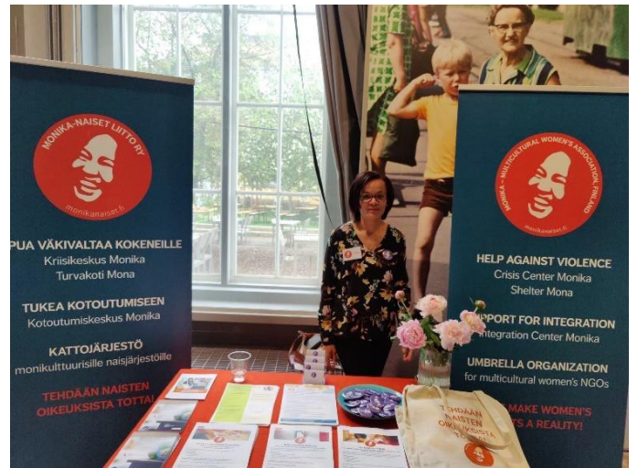
Palveluesittely Kuntoutussäätiön Kuntoutuspäivillä Helsingissä 2.-3.6.2022.

Vuoden aikana Monika-Naiset liitto osti yhden uuden tukiasunnon STEA:n investointiavustuksella.