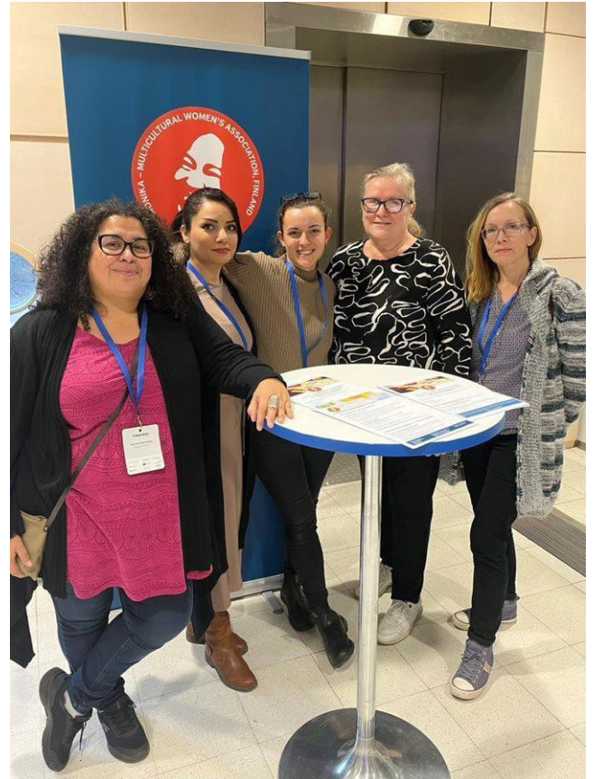
Toiminnan esittely Integration 2022 -tapahtumassa Tampereella 7.-8.11.2022.

Kotoutumiskeskuksessa tehtiin selvitystä asiakkaiden digiosaamisen haasteista ja niistä keskusteltiin työllisyyspalvelujen asiantuntijoiden kanssa.