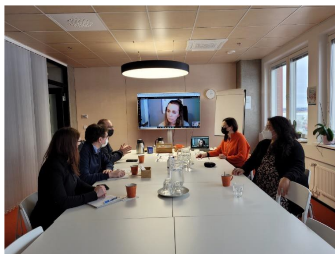
Yhteistyökokous Argentiinan suurlähetystön kanssa 21.3.2022.