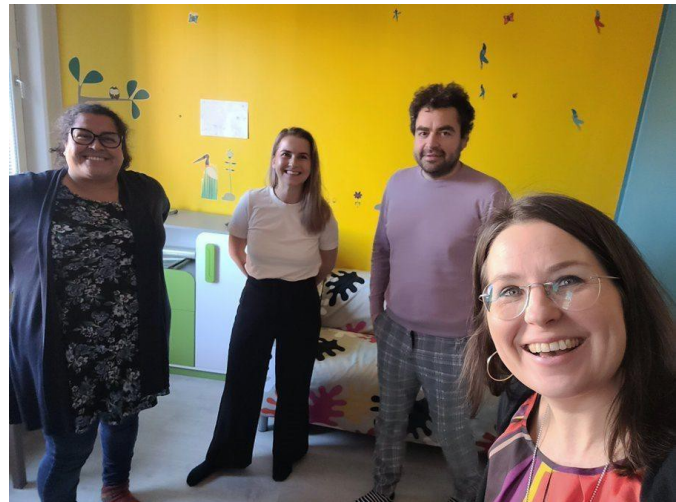
Pohjoismaiden ja Baltian UNCHR:n edustajat tutustumassa kotoutumispalveluihimme 12.10.2022.

Tarjosimme yksilöohjausta maahan muuttaneille naisille erilaisiin kotoutumisen ja työllistymisen haasteisiin Helsingin Kalasataman toimitiloissa maanantaista lauantaihin. Pystyimme tarjoamaan omakielistä ohjausta seuraavilla kielillä: arabia, englanti, venäjä, viro, farsi, dari ja espanja. Käytimme tarvittaessa myös tulkkaukspalvelua.