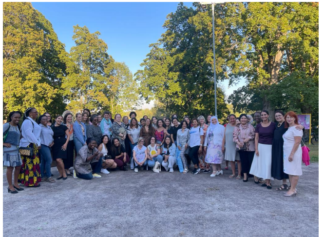
ENoMW-verkoston kokous 26.-29.8.2022.