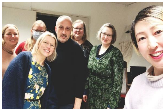
Koulutus naisiin kohdistuvan väkivallan temasta Oulun vastaanottokeskusten tukiyhdistys ry:n työntekijöille ja vapaaehtoisille 28.-29.11.2022.