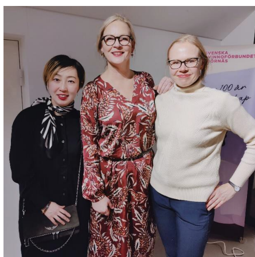
Yhteistyön kehittämistä kannatusjärjestömme Svenska Kvinnoförbundetin kanssa 2.12.2022.