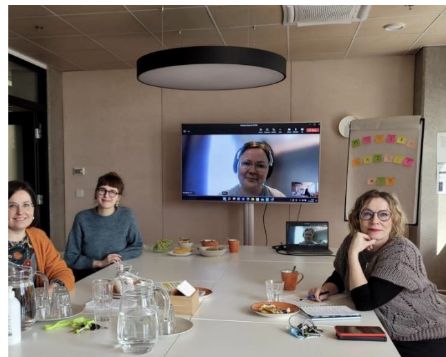
Nytkis ry toimintaan tutustumassa 29.4.2022.

Kriisikeskuksen asiantuntijat kävivät kouluttamassa kunnan ja HUS:n sosiaali- ja terveysalan ammattilaisia, yliopiston ja ammattikorkeakoulun opiskelijoita. Osallistujia oli 664 (v. 2021: 371). Teemana oli maahan muuttaneisiin naisiin kohdistuvan väkivallan erityispiirteet (pari- ja lähisuhdeväkivalta, kunniaan liittyvä väkivalta, avioliittoon pakottaminen, ihmiskauppa). Työntekijät pitivät 15 asiantuntijapuheenvuoroa erilaisissa tapahtumissa ja tilaisuuksiin osallistui yhteensä noin 1300 henkilöä. Työntekijät antoivat 11 media-, tutkimus- ja asiantuntijahaastattelua.