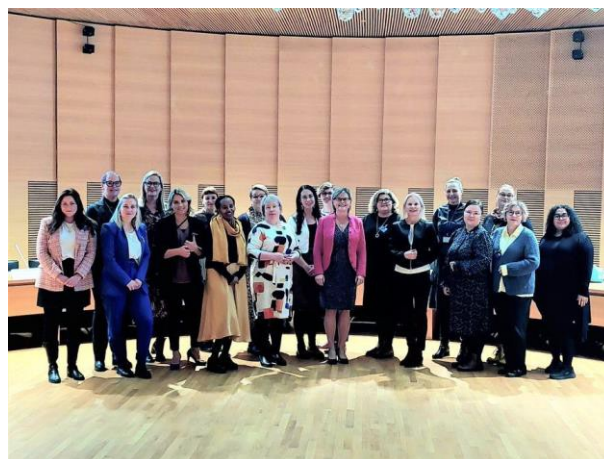
Naisjärjestöt luovuttamassa yhteiset hallitusohjelmataavoitteet 2023–2027 eduskunnan naisverkostolle 15.11.2022.