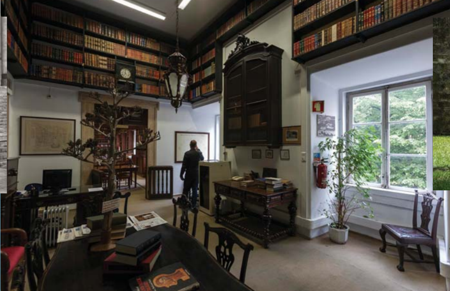
© DUARTE BELO - HOSPITAL DE SÃO JOSÉ – BIBLIOTECA

VIOLANT PORTUGAL 16 Desde SET 2015 – em permanência Fachada de edifício na Rua do Saco Em parceria com a GAU - Galeria de Arte Urbana