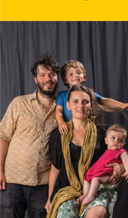
© LUIS PAVÃO - RETRATOS DE FAMÍLIAS

PORTUGAL NÃO É UM PAÍS PEQUENO 11 André Amália | Hotel Europa PORTUGAL 8 SET – 21h00 | 10 SET – 17h00 11 SET – 19h00 [duração 90min] M/12 Academia Militar – Rua Gomes Freire Portugal sofreu a mais longa ditadura fascista da Europa (48 anos), e o mais persistente império colonial (500 anos). Partindo dos testemunhos de antigos colonos portugueses entrevistados pelo autor, este espetáculo de teatro documental reflete sobre a ditadura e a complexidade do fim do colonialismo português. Reproduzindo fielmente as suas palavras, André Amália explora situações onde pessoas reais contestam e reconstrõem identidades culturais. Um contributo para a reescrita da história e transmissão da memória entre gerações. Lotação limitada a 140 pessoas S A